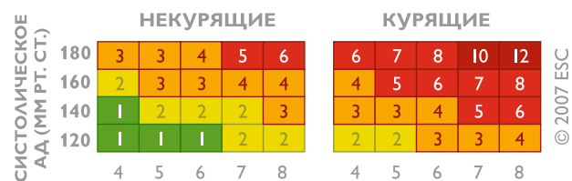
ОБЩИЙ ХОЛЕСТЕРИН ШКАЛА ОТНОСИТЕЛЬНОГО РИСКА

Для людей моложе 40 лет рекомендуется пользоваться Шкалой относительного риска . Шкала используется безотносительно пола и возраста человека и учитывает три фактора: систолическое (верхнее) артериальное давление, уровень общего холестерина и факт курения . Технология ее использования аналогична таковой для основной Шкалы SCORE.